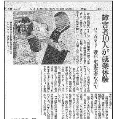
イオンモール武蔵村山ミューでのインターンシップの様子が読売新聞に掲載されました(2010年9月16日)