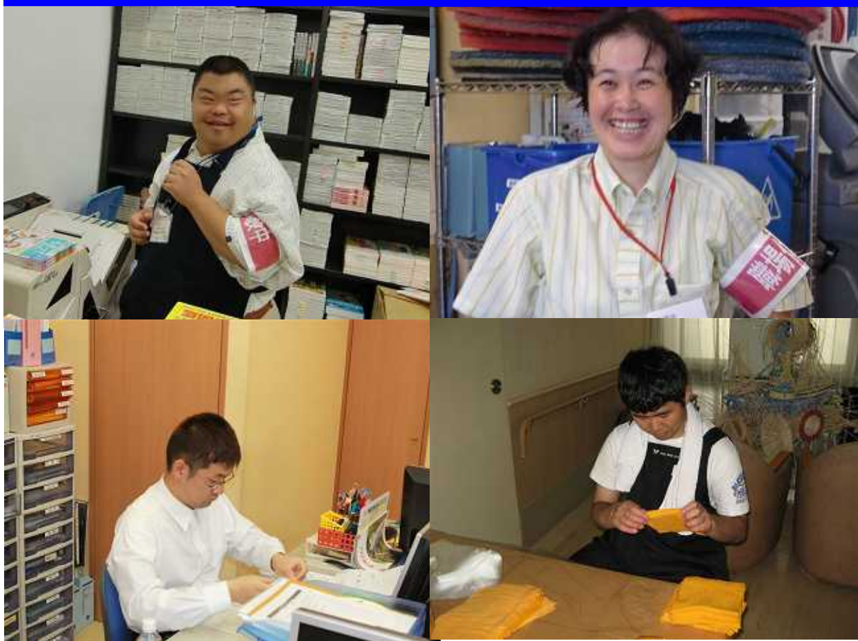
写真：平成22年度職場実習事業の様子