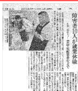
インターンシップの様子が 読売新聞に掲載されました(2010年9月16日)