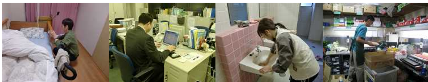
写真：平成22年度職場実習事業の様子