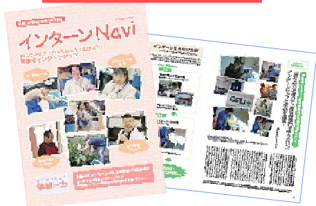
実習の様子は カラー冊子の報告書におまとめします。